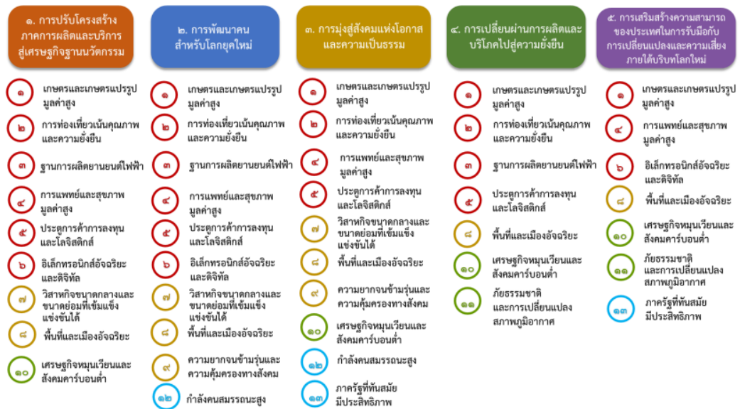
แผนภาพความเชื่อมโยงระหว่างหมวดหมู่การพัฒนากับเป้าหมายหลัก

ความเชื่อมโยงระหว่างหมวดหมู่การพัฒนากับเป้าหมายหลักแสดงไว้ในแผนภาพด้านล่าง โดยหมวดหมู่การพัฒนาที่กำหนดขึ้นเป็นประเด็นที่มีลักษณะเชิงบูรณาการที่ครอบคลุมการพัฒนาตั้งแต่ในระดับต้นน้ำจนถึง ปลายน้ำ และสามารถนำไปสู่ผลพัฒนาทั้งในมิติเศรษฐกิจ สังคม ทรัพยากรธรรมชาติและสิ่งแวดล้อม ไปพร้อม ๆ กัน ทำให้หมวดหมู่แต่ละประการสามารถสนับสนุนเป้าหมายหลักได้มากกว่าหนึ่งข้อ นอกจากนี้ การพัฒนาภายใต้แต่ละหมวดหมู่ไม่ได้แยกขาดจากกัน แต่มีการสนับสนุนหรือเอื้อประโยชน์ซึ่งกันและกัน